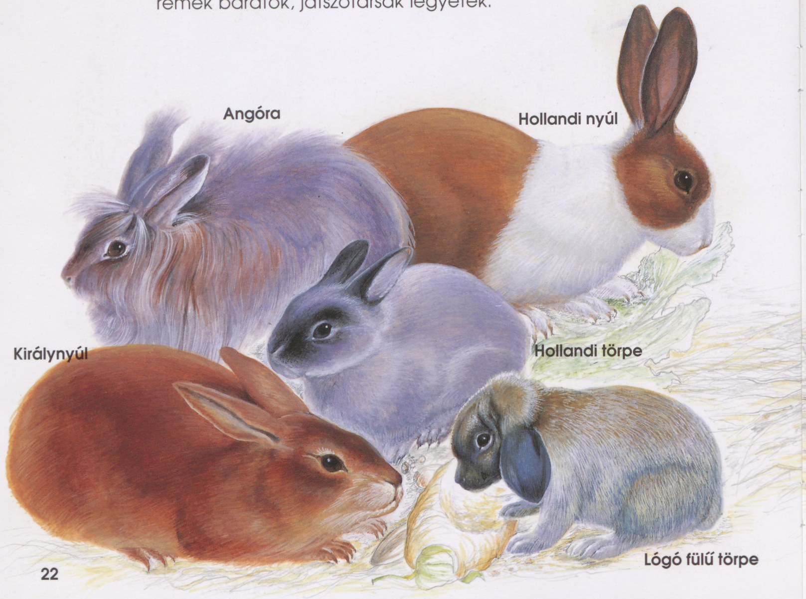
Lógó fülű törpe