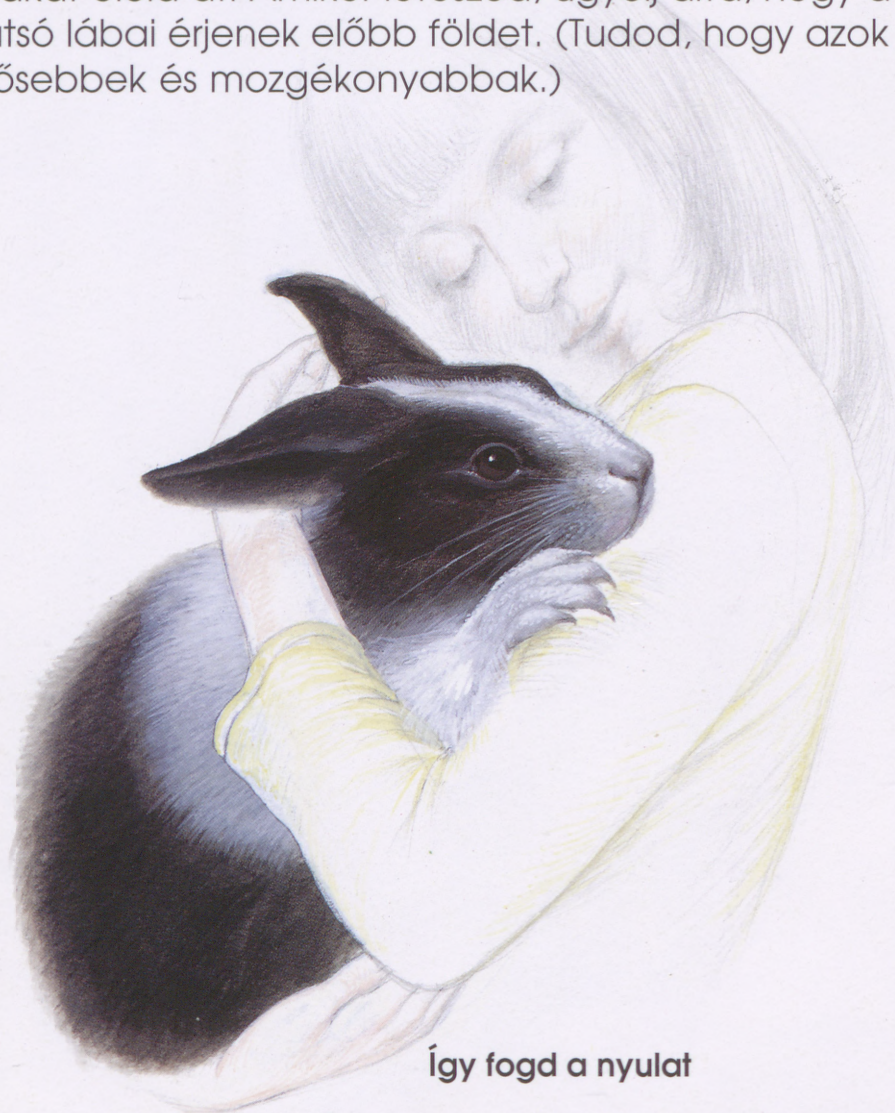
Így fogd a nyulat

A nyulak természetüknél fogva félénkek és ijedős teremtmények. Gyengéden beszélj velük, miközben a kezébe veszed. Mikor felemeled, egyik kezéddel a hátsó fele alá nyúlj, hogy elbírd a súlyát, a másikkal a nyakát öleld át. Amikor leteszed, ügyelj arra, hogy a hátsó lábai érjenek előbb földet. (Tudod, hogy azok az erősebbek és mozgékonyabbak.)