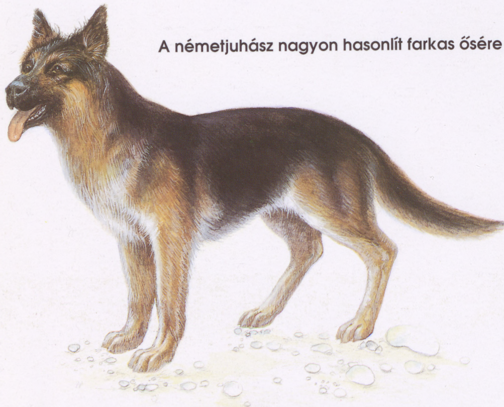
A németjuhász nagyon hasonlít farkas ősére

A nagy testű kutyák általában 8-10 éves korukig, a kisebb testűek 14-15 éves korukig is élnek.